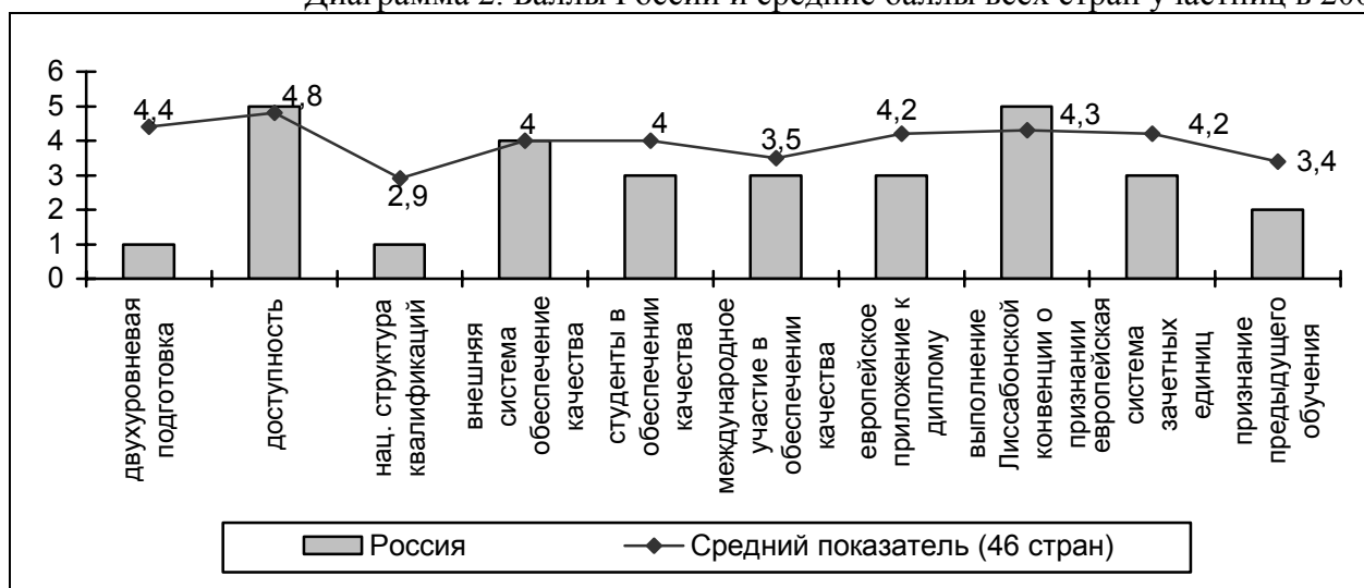
Диаграмма 2. Баллы России и средние баллы всех стран участниц в 2009 г. 2

Диаграмма 2 представляет собой сравнение показателей России в 2009 году со средними показателями всех стран участниц. Лишь по трем показателям из десяти баллы России превышают